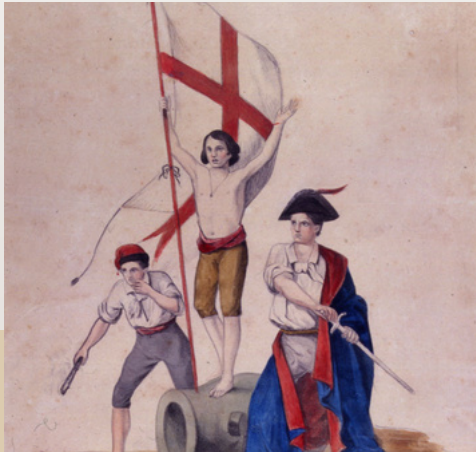
I tre eroi del popolo zeneize, litografia anonima colorata a matita, 1847-48 ca. (Genova, Museo del Risorgimento)

Il 1848 europeo, laboratorio di modernità politica e mediatica