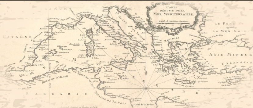
Image : J.-N. Bellin, Carte réduite de la mer Méditerranée, 1764".

DE LA FIN DU XVIII E SIÈCLE À LA PREMIÈRE GUERRE MONDIALE